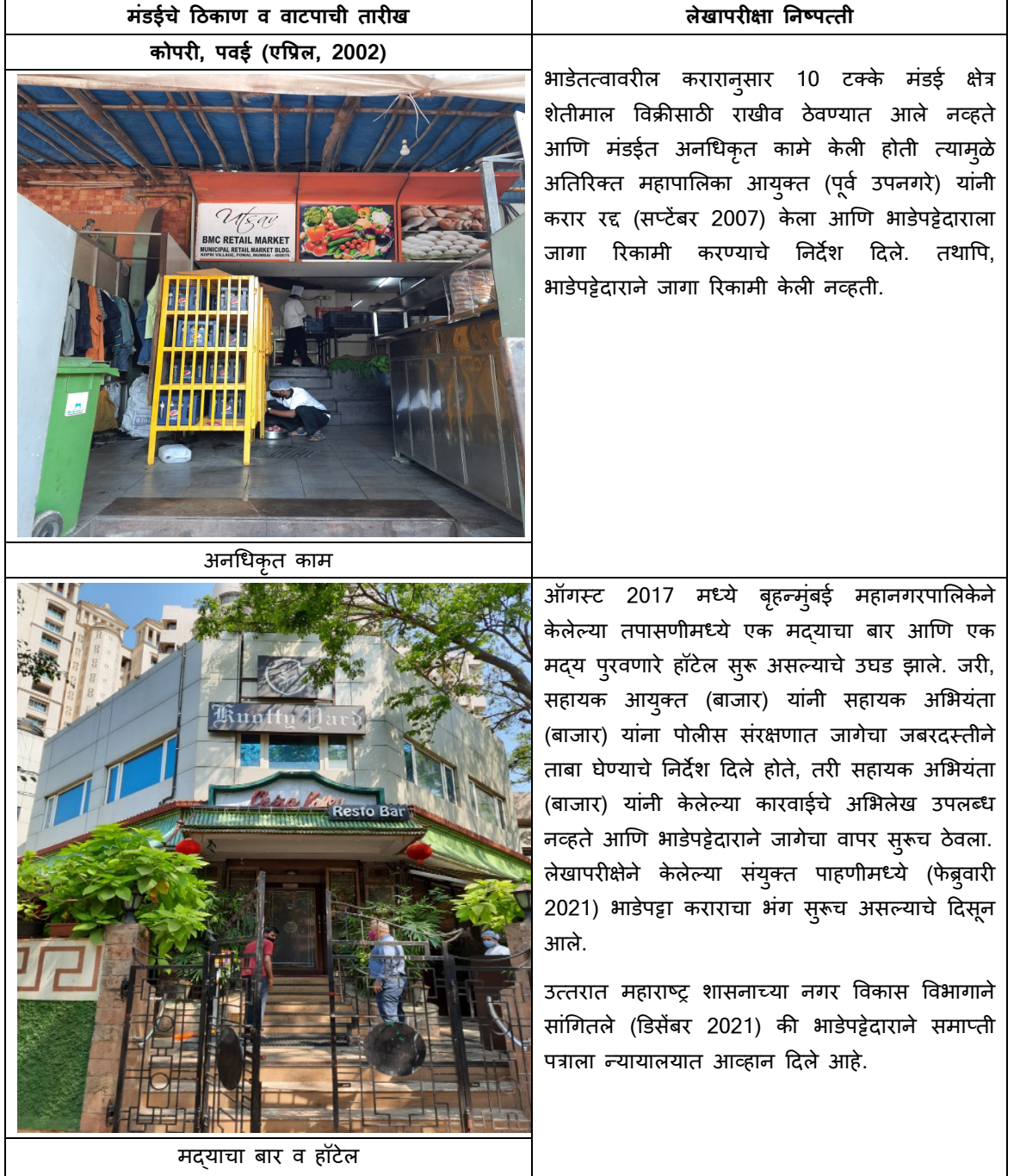
तक्ता 2.2.2 : भाडेपट्टा करारांच्या अटीचे पालन न करणे

किंवा कोणत्याही इतर संस्था यांना विशिष्ट बाजार सेवा वाटप करण्याची परवानगी होती. संयुक्त पाहणी व अभिलेख्यांच्या चाचणी-तपासणीत तक्ता 2.2.2 मध्ये दर्शविल्याप्रमाणे भाडेपट्टा करारातील अटीचा भंग केल्याचे दिसून आले.